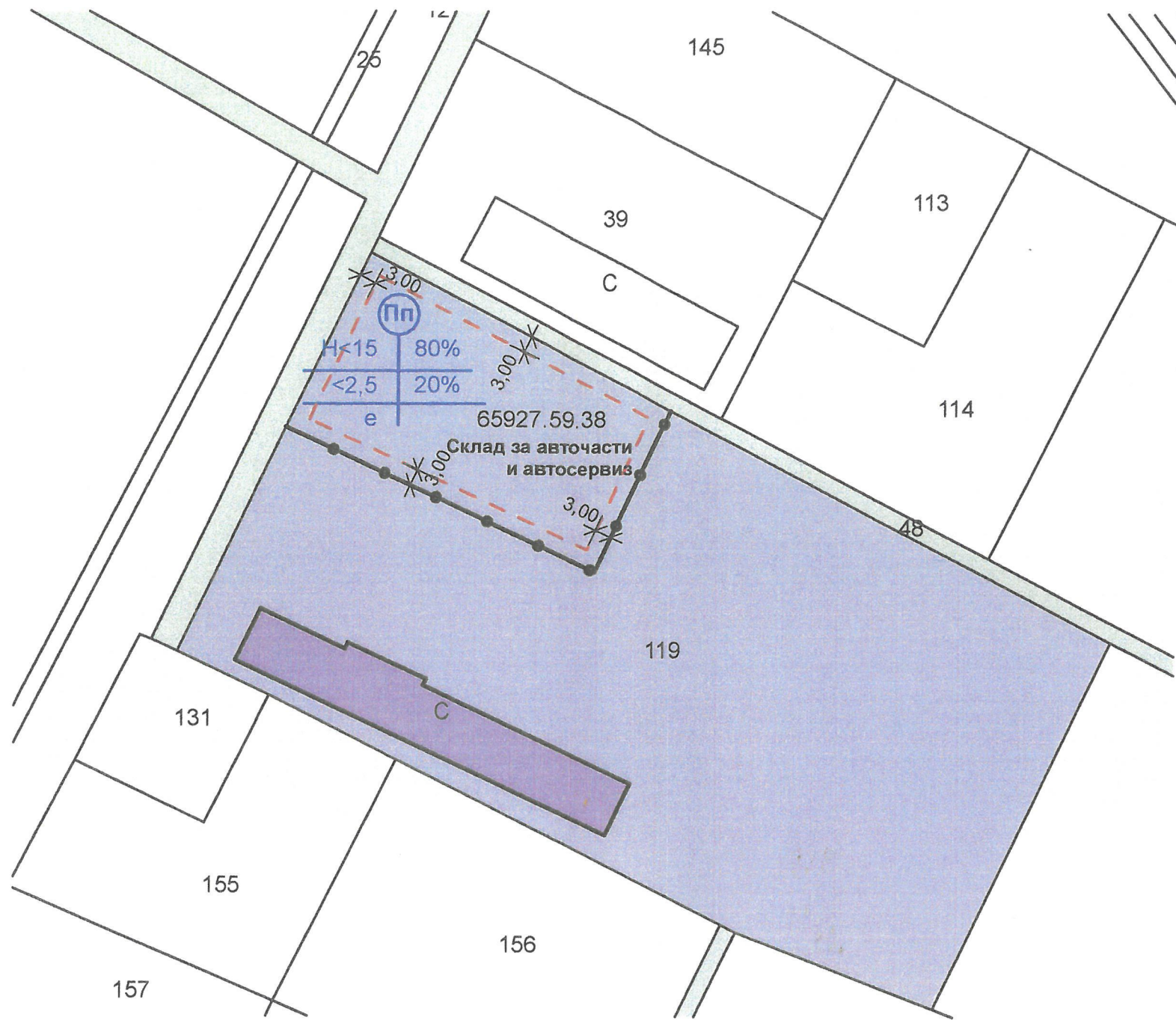
ПЛАН ЗА ЗАСТРОЯВАНЕ М 1:1000